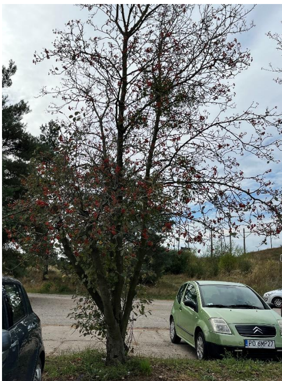
Ryc. 10 Nr inwentaryzacyjny 10