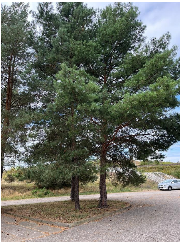
Ryc. 14 Nr inwentaryzacyjny 14, 15

Źródło: Zdjęcie własne, dn. 09.09.2024 r.