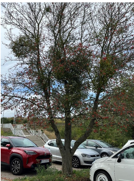
Ryc. 11 Nr inwentaryzacyjny 11