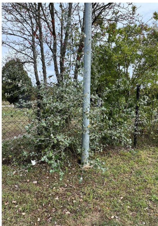
Ryc. 1 Nr inwentaryzacyjny 1

Źródło: Zdjęcie własne, dn. 09.09.2024 r.