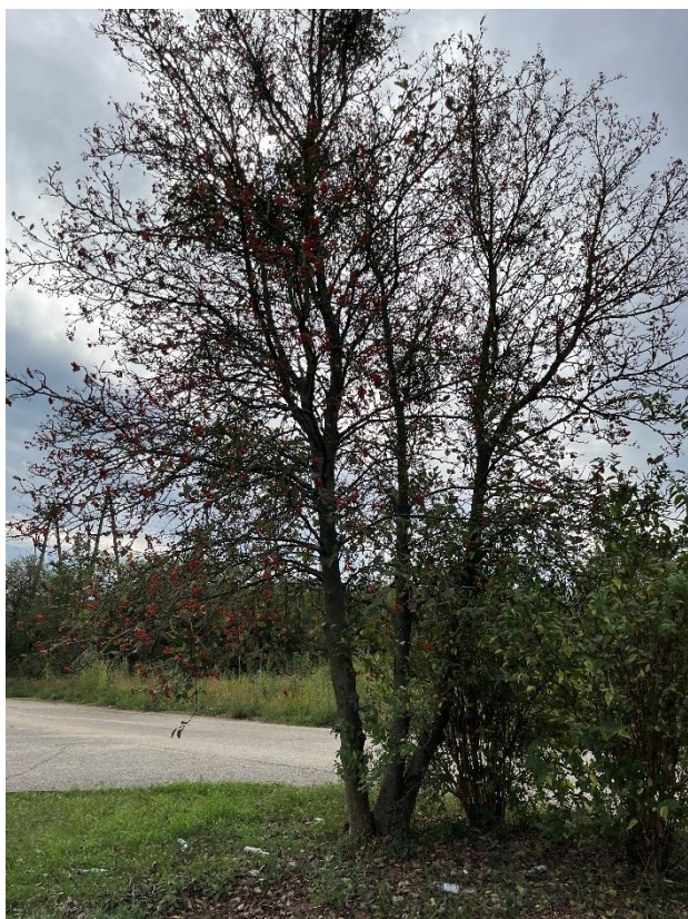
Ryc. 25 Nr inwentaryzacyjny 25