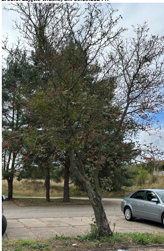
Ryc. 8 Nr inwentaryzacyjny 8

Źródło: Zdjęcie własne, dn. 09.09.2024 r.