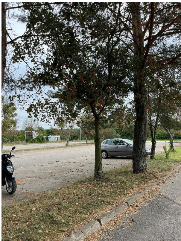
Ryc. 17 Nr inwentaryzacyjny 18

Źródło: Zdjęcie własne, dn. 09.09.2024 r.