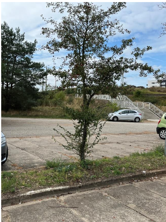
Ryc. 9 Nr inwentaryzacyjny 9