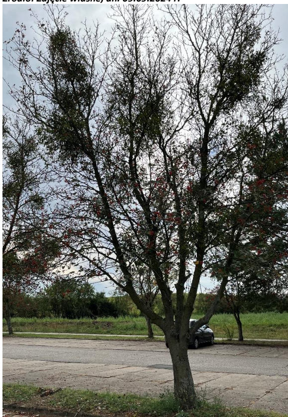
Ryc. 7 Nr inwentaryzacyjny 7