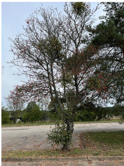
Ryc. 3 Nr inwentaryzacyjny 3