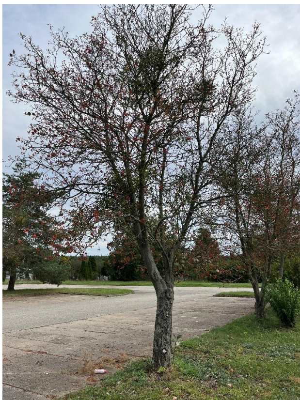
Ryc. 21 Nr inwentaryzacyjny 22