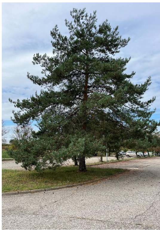
Ryc. 2 Nr inwentaryzacyjny 2