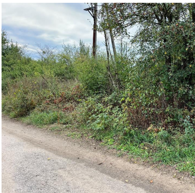
Ryc. 27 Nr inwentaryzacyjny 28

Źródło: Zdjęcie własne, dn. 09.09.2024 r.