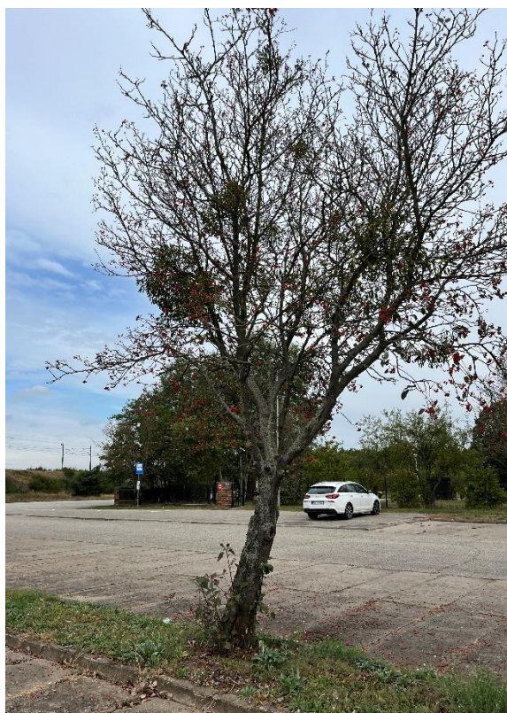
Ryc. 5 Nr inwentaryzacyjny 5