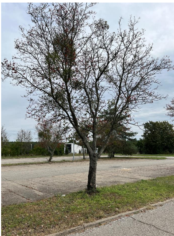
Ryc. 20 Nr inwentaryzacyjny 21