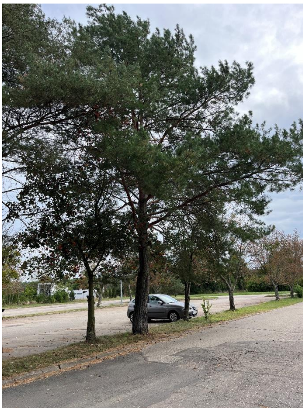
Ryc. 18 Nr inwentaryzacyjny 19