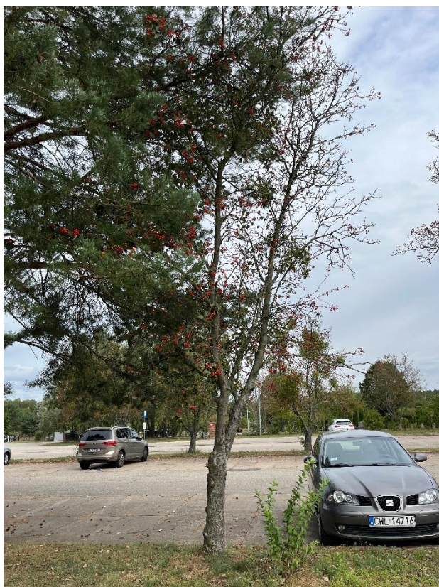
Ryc. 19 Nr inwentaryzacyjny 20

Źródło: Zdjęcie własne, dn. 09.09.2024 r.