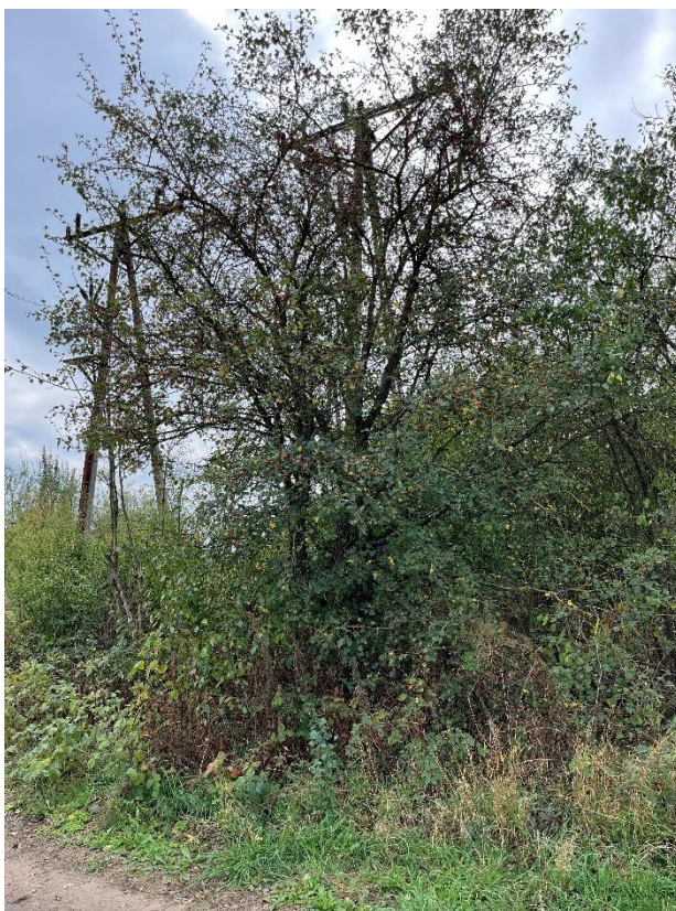
Ryc. 26 Nr inwentaryzacyjny 27

dn. 09.09.2024 r.