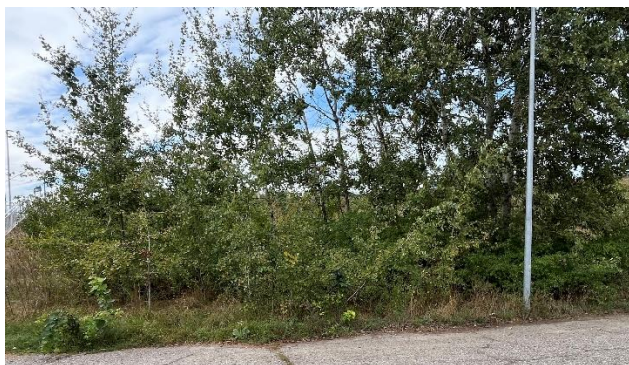
Ryc. 13 Nr inwentaryzacyjny 13

Źródło: Zdjęcie własne, dn. 09.09.2024 r.