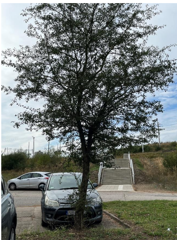
Ryc. 12 Nr inwentaryzacyjny 12