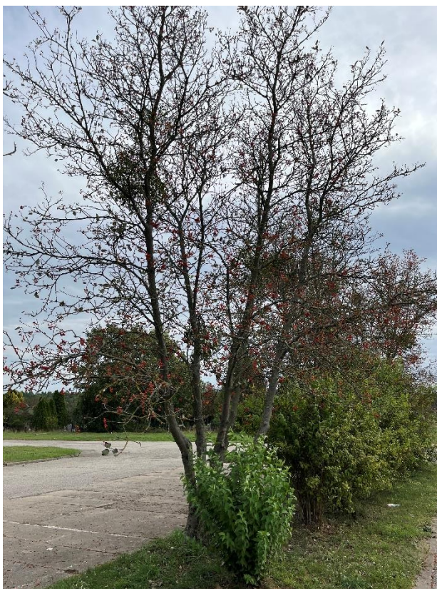
Ryc. 22 Nr inwentaryzacyjny 23