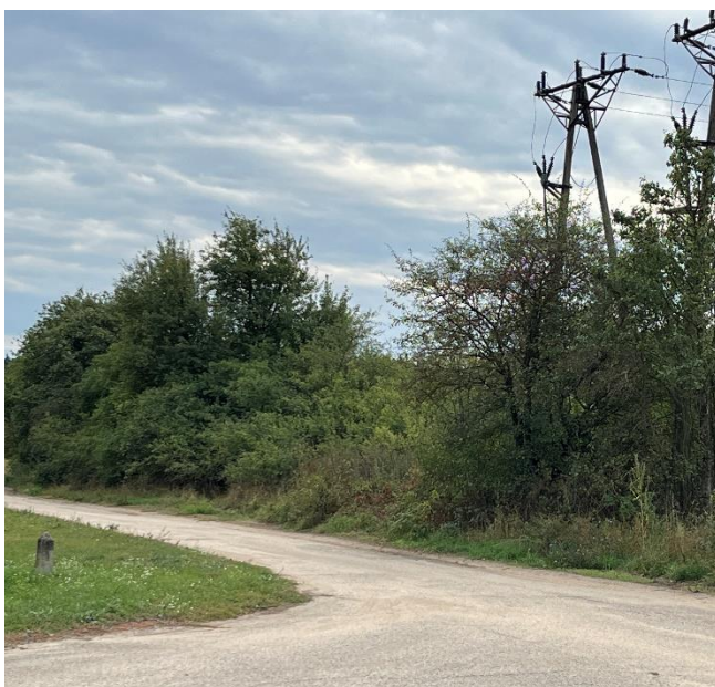
Ryc. 28 Nr inwentaryzacyjny 27, 28