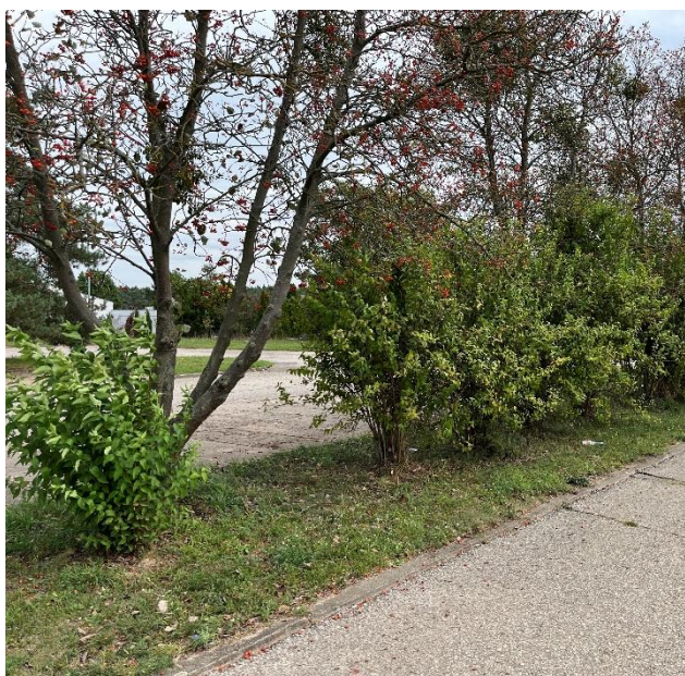
Ryc. 23 Nr inwentaryzacyjny 23, 26

Źródło: Zdjęcie własne, dn. 09.09.2024 r.