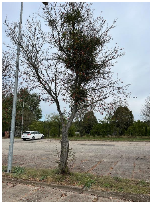
Ryc. 4 Nr inwentaryzacyjny 4

Źródło: Zdjęcie własne, dn. 09.09.2024 r.