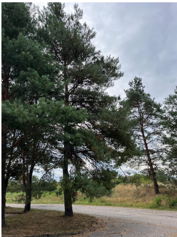
Ryc. 15 Nr inwentaryzacyjny 16