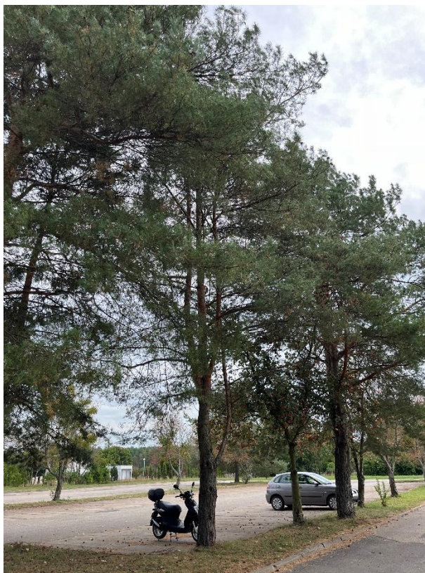
Ryc. 16 Nr inwentaryzacyjny 17

Źródło: Zdjęcie własne, dn. 09.09.2024 r.