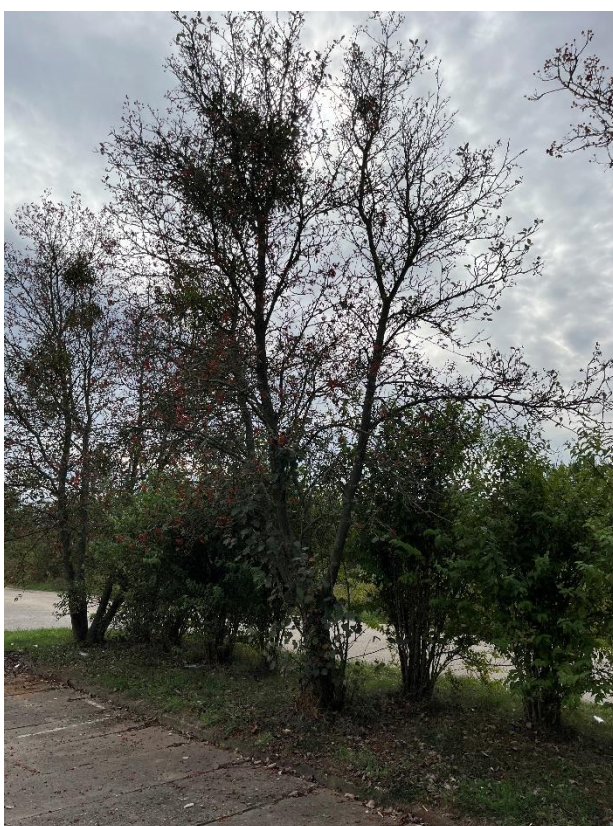
Ryc. 24 Nr inwentaryzacyjny 24, 25, 26

Źródło: Zdjęcie własne, dn. 09.09.2024 r.